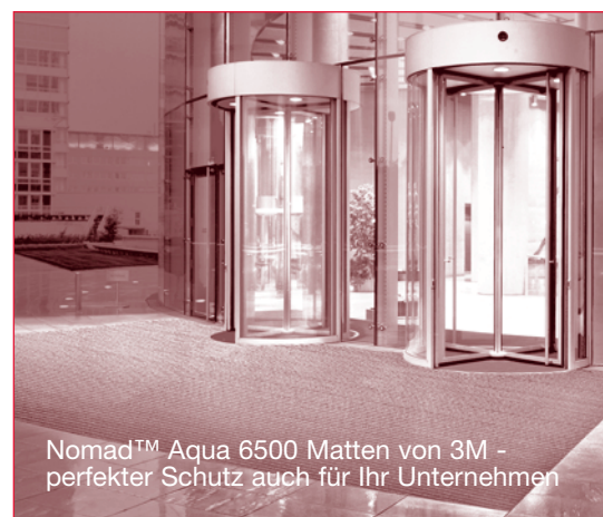
Nomad™ Aqua 6500 Matten von 3M - perfekter Schutz auch für Ihr Unternehmen

die Aufnahme von Feinschmutz und Nässe im Innenbereich. Die offene Faserstruktur garantiert leichte Reinigung und schnelles Abtrocknen von Nässe. Die einfache Grundidee der Kombination von groben Fasern für das Abbürsten von Sohlen und feinen Fasern für die Aufnahme von Nässe, stellt eine optimale Aufnahme von Schmutz und Nässe sicher.